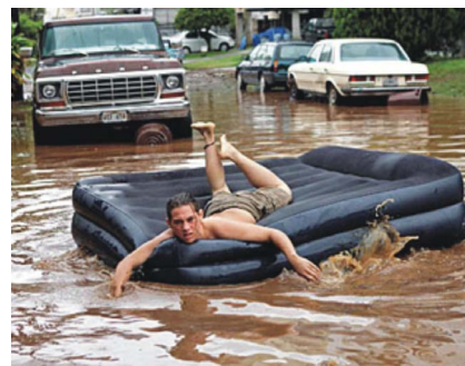
Katrina: Wake-up call