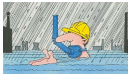
Als het kalf verdronken is, dempt men de put...

Na het uitvoeren van deze Climate Check heeft u inzicht in welke mate de riolering, de waterzuivering en/of het koelsysteem klimaatbestendig is. Ook wordt duidelijk bij welk klimaat-scenario aanpassing van een of meerdere systemen (op termijn) wenselijk of zelfs noodzakelijk is.