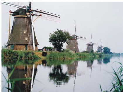
Pompen of verzuipen: meer dan een mooie traditie

De Climate Check begint met het verzamelen van gegevens, zoals ontwerpdocumenten, monitoringsgegevens rond waterkwaliteit- en waterkwantiteit, specifieke gegevens rond de riolering, waterzuivering en koelinstallaties. Aan de hand van deze gegevens brengt Royal Haskoning de relevante systemen snel en effectief in kaart.